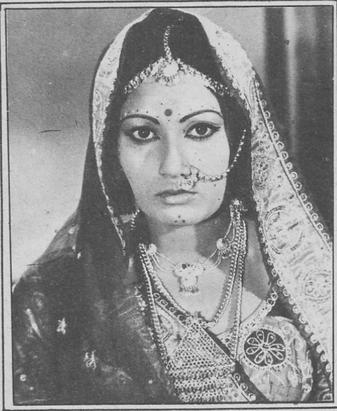
'રાણો કુંવર'માં રાગિણી.

પ્રેક્ષકોને ધ્યાનમાં લઈને ફિલ્મ બનાવવી પડે છે.'